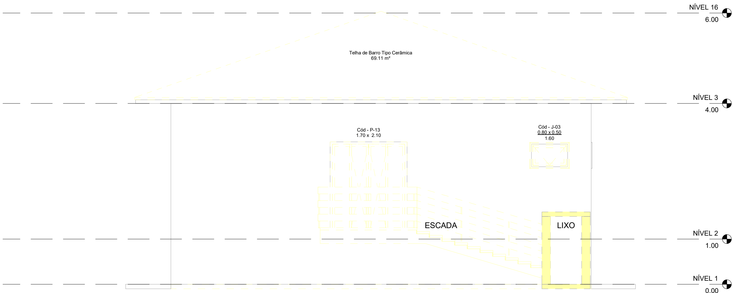
D.B 1 : 50